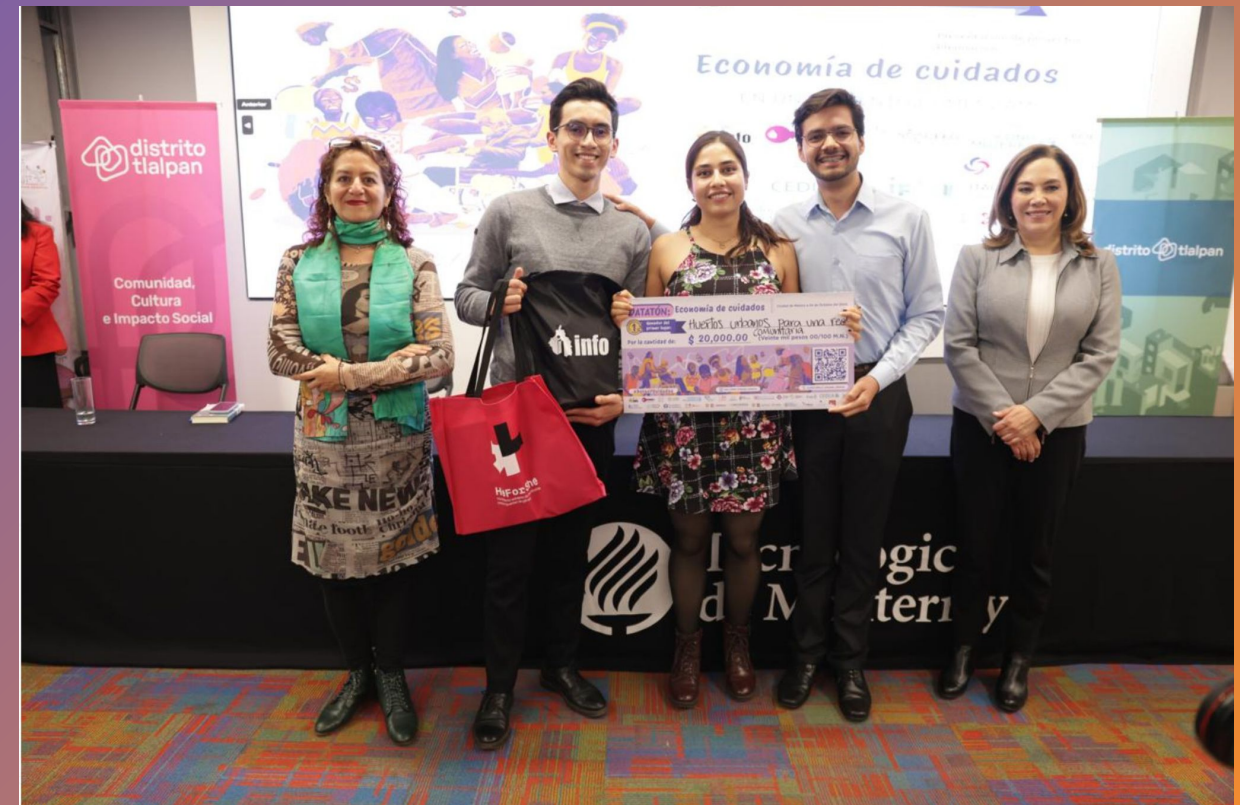
Tres Tristes Tigres: Huertos urbanos para una red comunitaria de cuidados